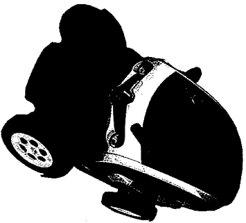
3 Quadricycle léger